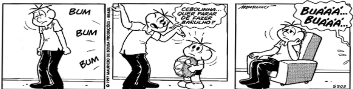
Copyright ©1999 Mauricio de Sousa Produções Ltda. Todos os direitos reservados.

5) A tira abaixo apresentam onomatopeias, indique quais são e o que representam;